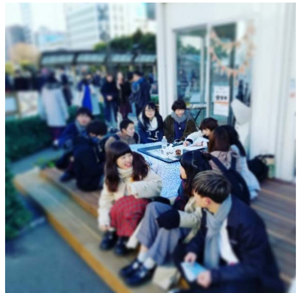
ココタの利用イメージ (2018年1月東口EKITUZI内)

2015年12月の仙台市営地下鉄東西線「連坊駅」の開業によって、連坊の商店街を通学・通勤ルートにしていた高校生や社会人も地下鉄を利用するようになり、連坊の商店街とは接点を失っていきました。そんな連坊の商店街と、高校生や大学生、社会人といった若者が、ゆるく楽しく接点を持ち、地域の商店街の魅力を知るきっかけ作りとして、本企画を立案しました。